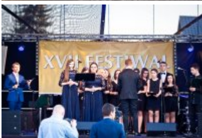
XVII Festiwal Ave Maria