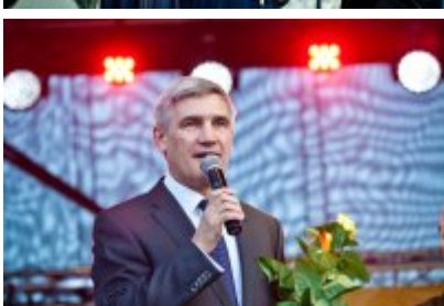
XVII Festiwal Ave Maria