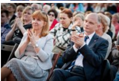
XVII Festiwal Ave Maria