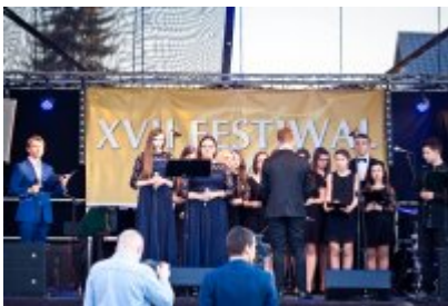
XVII Festiwal Ave Maria