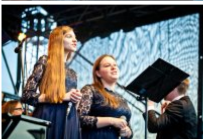
XVII Festiwal Ave Maria