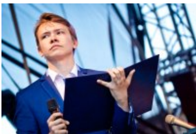
XVII Festiwal Ave Maria