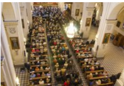
XVII Festiwal Ave Maria