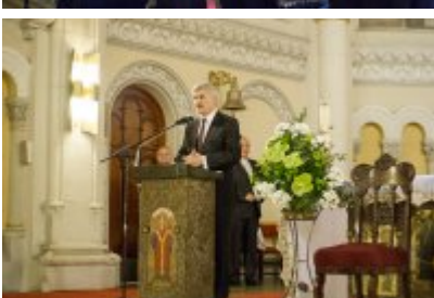
XVII Festiwal Ave Maria