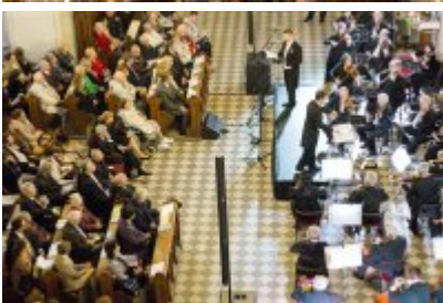
XVII Festiwal Ave Maria