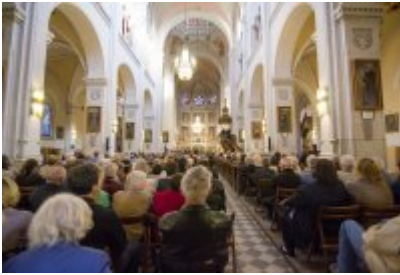
XVII Festiwal Ave Maria