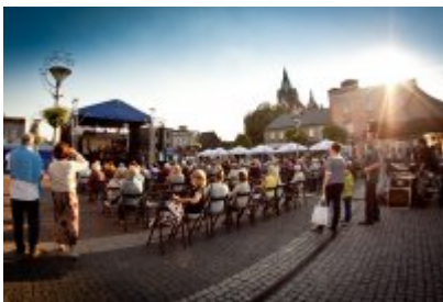
XVII Festiwal Ave Maria