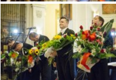
XVII Festiwal Ave Maria