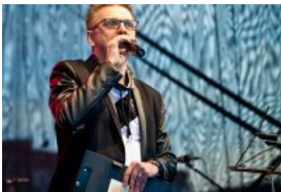
XVII Festiwal Ave Maria