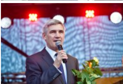
XVII Festiwal Ave Maria