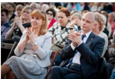
XVII Festiwal Ave Maria