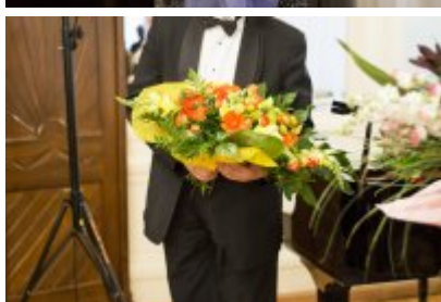
XVII Festiwal Ave Maria