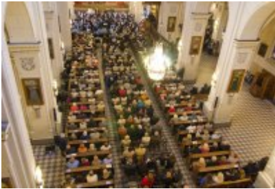
XVII Festiwal Ave Maria