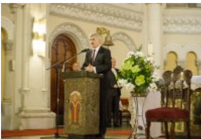
XVII Festiwal Ave Maria