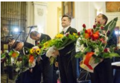
XVII Festiwal Ave Maria