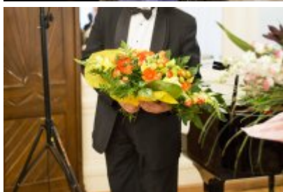
XVII Festiwal Ave Maria