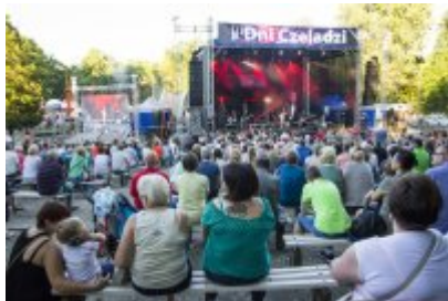
Dni Czeladzi - Dzień pierwszy