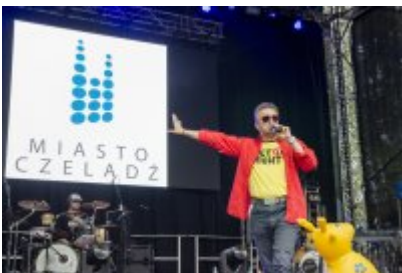
Dni Czeladzi - Dzień drugi