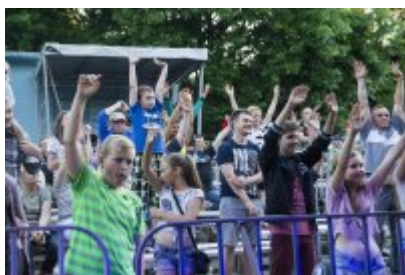
Dni Czeladzi - Dzień pierwszy