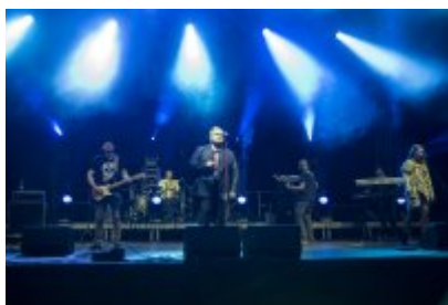
Dni Czeladzi - Dzień pierwszy