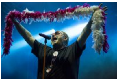
Dni Czeladzi - Dzień pierwszy