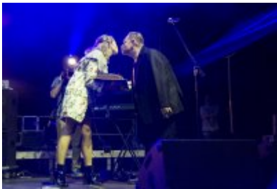
Dni Czeladzi - Dzień pierwszy