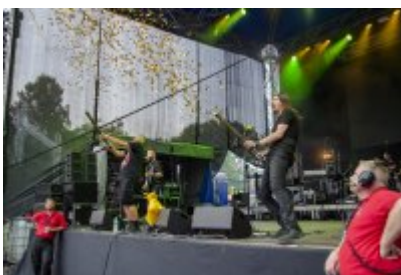
Dni Czeladzi - Dzień drugi