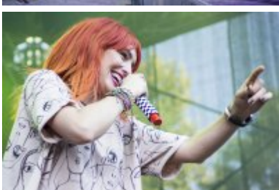
Dni Czeladzi - Dzień pierwszy