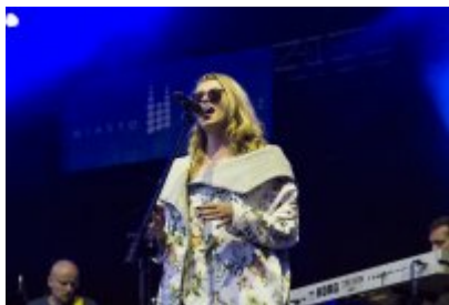
Dni Czeladzi - Dzień pierwszy