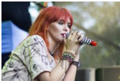
Dni Czeladzi - Dzień pierwszy