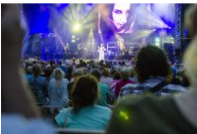
Dni Czeladzi - Dzień drugi