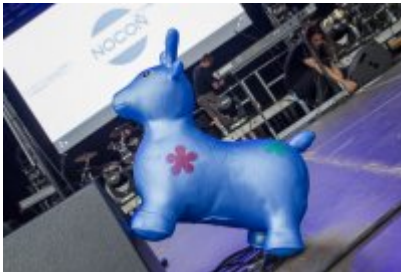
Dni Czeladzi - Dzień drugi