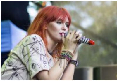
Dni Czeladzi - Dzień pierwszy