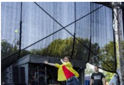
Dni Czeladzi - Dzień pierwszy