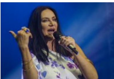
Dni Czeladzi - Dzień drugi