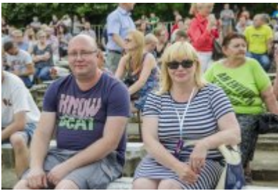
Dni Czeladzi - Dzień drugi