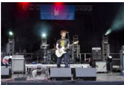
Dni Czeladzi - Dzień pierwszy