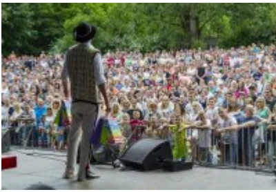
Dni Czeladzi - Dzień drugi