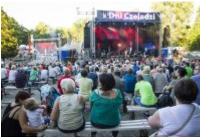
Dni Czeladzi - Dzień pierwszy