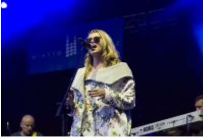
Dni Czeladzi - Dzień pierwszy