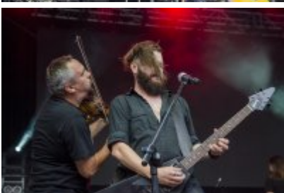
Dni Czeladzi - Dzień drugi