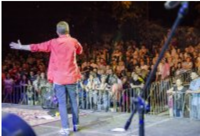
Dni Czeladzi - Dzień drugi