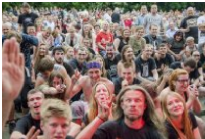
Dni Czeladzi - Dzień drugi