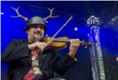
Dni Czeladzi - Dzień drugi