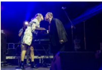
Dni Czeladzi - Dzień pierwszy