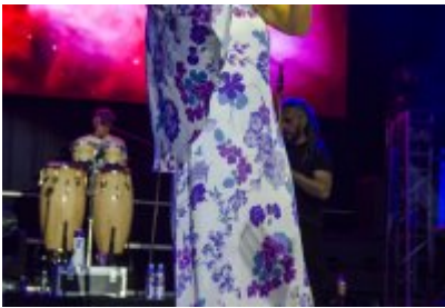
Dni Czeladzi - Dzień drugi