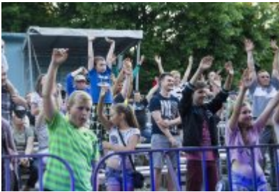
Dni Czeladzi - Dzień pierwszy