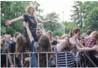
Dni Czeladzi - Dzień drugi