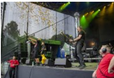
Dni Czeladzi - Dzień drugi