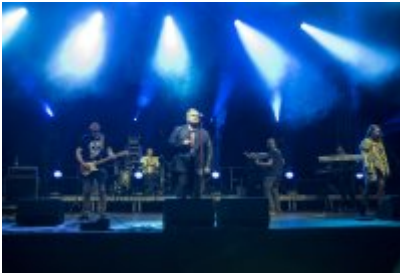
Dni Czeladzi - Dzień pierwszy