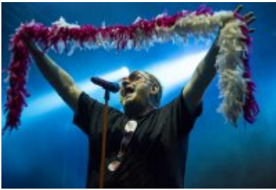
Dni Czeladzi - Dzień pierwszy