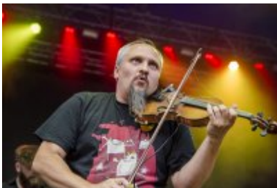
Dni Czeladzi - Dzień drugi