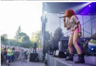
Dni Czeladzi - Dzień pierwszy