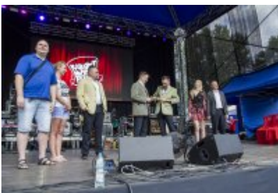
Dni Czeladzi - Dzień drugi