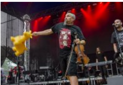
Dni Czeladzi - Dzień drugi