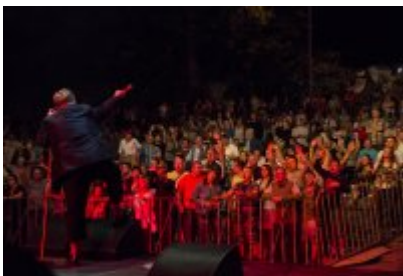
Dni Czeladzi - Dzień pierwszy