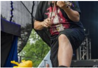
Dni Czeladzi - Dzień drugi