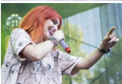
Dni Czeladzi - Dzień pierwszy