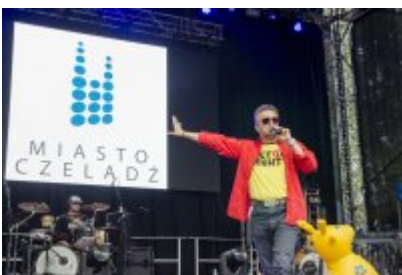
Dni Czeladzi - Dzień drugi