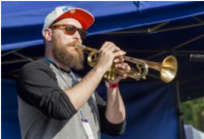
Dni Czeladzi - Dzień drugi