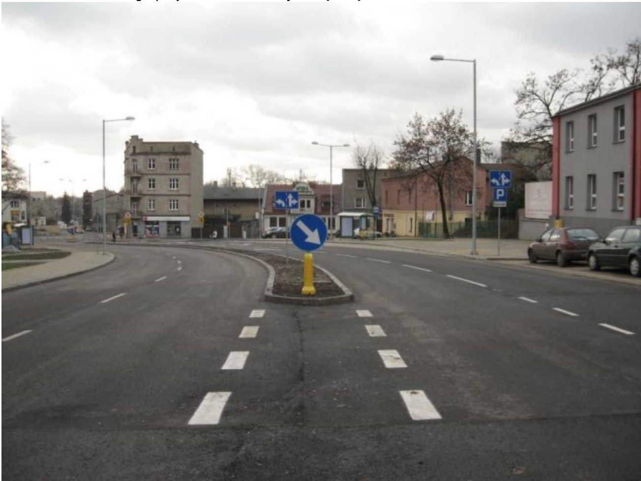
Ulica Szpitalna po realizacji