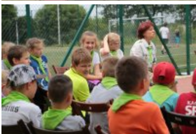
Zakończenie Nieobozowej Akcji Lato