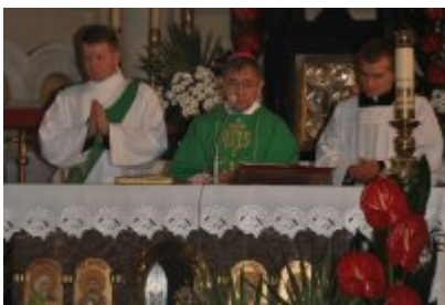
• Światowe Dni Młodzieży