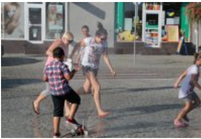
• Pożegnanie wakacji