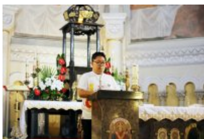
Msza święta z udziałem pielgrzymów z Brunei