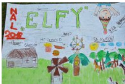
Zakończenie II turnusu Nieobozowej Akcji Lato