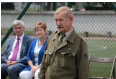
Zakończenie Nieobozowej Akcji Lato