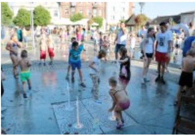
• Pożegnanie wakacji