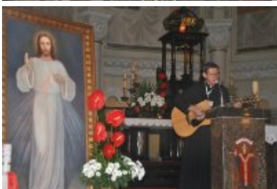
• Światowe Dni Młodzieży