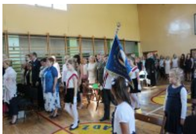
• Rozpoczęcie roku szkolnego