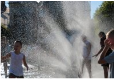
• Pożegnanie wakacji