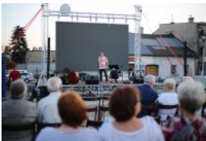
• Szalom na Rynku