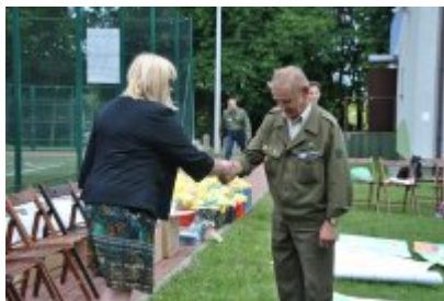
Zakończenie II turnusu Nieobozowej Akcji Lato