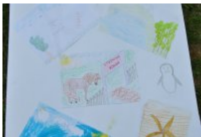
Zakończenie II turnusu Nieobozowej Akcji Lato