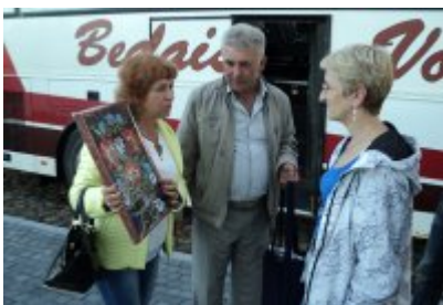
• Miasto Czeladź otrzymuje prezent od delegacji z Białorusi