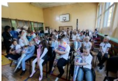
• Rozpoczęcie roku szkolnego