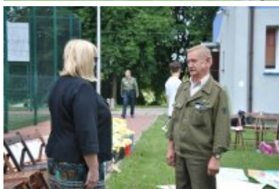
Zakończenie II turnusu Nieobozowej Akcji Lato