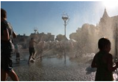
• Pożegnanie wakacji