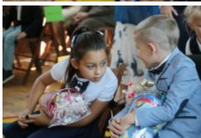
• Rozpoczęcie roku szkolnego