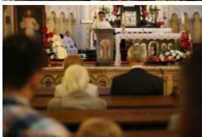
Msza święta z udziałem pielgrzymów z Brunei