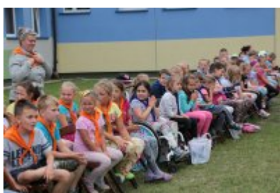
Zakończenie Nieobozowej Akcji Lato