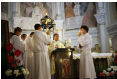
• Msza święta z udziałem pielgrzymów z Brunei