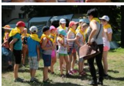
Rozpoczęcie II turnusu Nieobozowej Akcji Lato