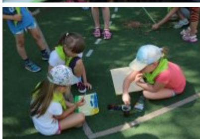
Rozpoczęcie II turnusu Nieobozowej Akcji Lato