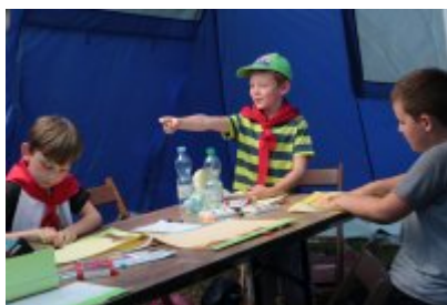
Rozpoczęcie II turnusu Nieobozowej Akcji Lato