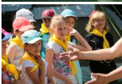
Rozpoczęcie II turnusu Nieobozowej Akcji Lato