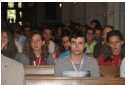
• Światowe Dni Młodzieży