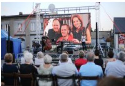
• Szalom na Rynku