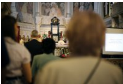
• Msza święta z udziałem pielgrzymów z Brunei