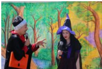
• "Być dorosłą bardzo chciała i na miotle odleciała"