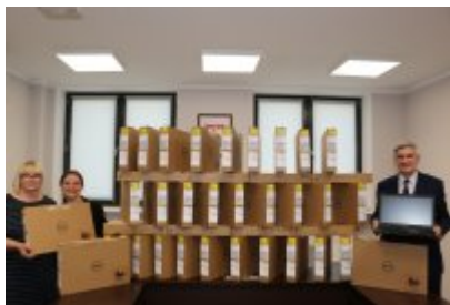
Komputery dla czeladzkich uczniów