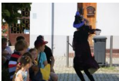
• "Być dorosłą bardzo chciała i na miotle odleciała"