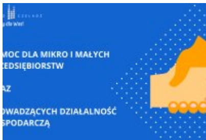
Działania Miasta Czeladź wspierające mieszkańców w czasie epidemii