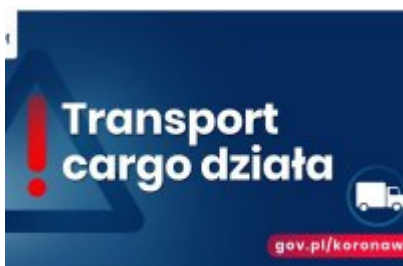
Stan zagrożenia epidemicznego (stan na 13.03.2020)