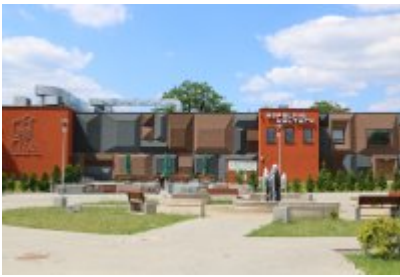
• Kopalnia Kultury w Czeladzi