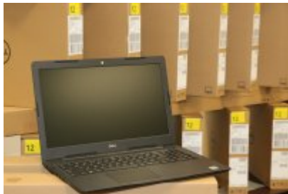
Komputery dla czeladzkich uczniów