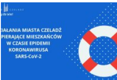
Działania Miasta Czeladź wspierające mieszkańców w czasie epidemii