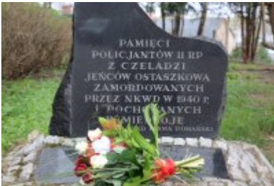
Czeladź pamięta o ofiarach Zbrodni Katyńskiej