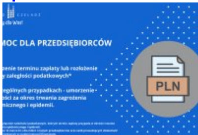
Działania Miasta Czeladź wspierające mieszkańców w czasie epidemii