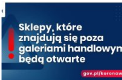
Stan zagrożenia epidemicznego (stan na 13.03.2020)