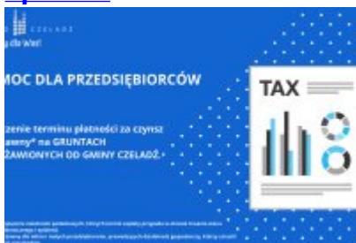
Działania Miasta Czeladź wspierające mieszkańców w czasie epidemii