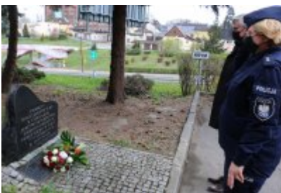
Czeladź pamięta o ofiarach Zbrodni Katyńskiej