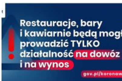
Stan zagrożenia epidemicznego (stan na 13.03.2020)