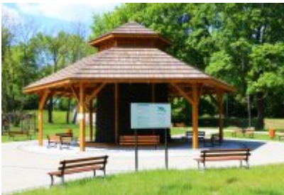
• Teżnia w Parku Grabek