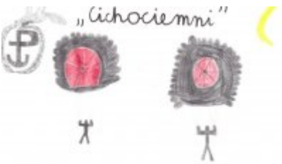
• Konkurs "Pamiętamy"