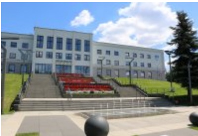
• Urząd Miasta 1