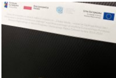
Komputery dla czeladzkich uczniów