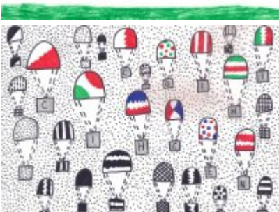
• Konkurs "Pamiętamy"