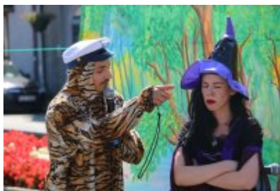
• "Być dorosłą bardzo chciała i na miotle odleciała"