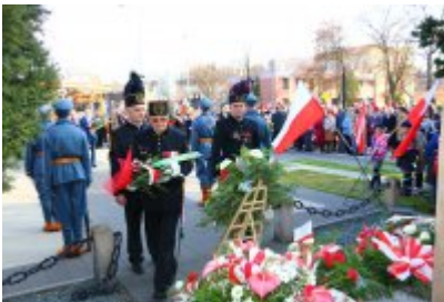
• Obchody 100-lecia odzyskania niepodległości cz. 2