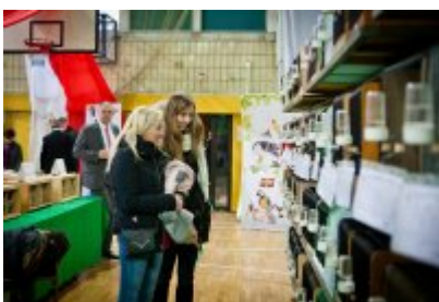
• 81. Ornitologiczne Mistrzostwa Polski