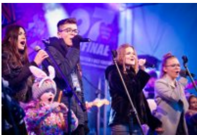
• 27. Finał Wielkiej Orkiestry Świątecznej Pomocy