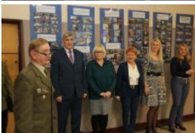
Harcerska Akcja Zima