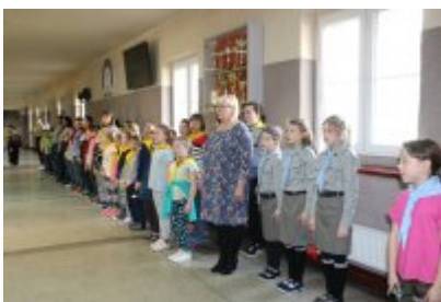
Zakończenie I turnusu HAZ