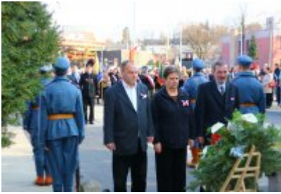
• Obchody 100-lecia odzyskania niepodległości cz. 2