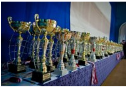
• 81. Ornitologiczne Mistrzostwa Polski