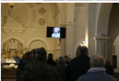
• Odświeżenie pomnika Jurka Bitschana