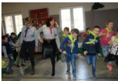
Zakończenie I turnusu HAZ