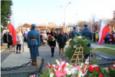
• Obchody 100-lecia odzyskania niepodległości cz. 2