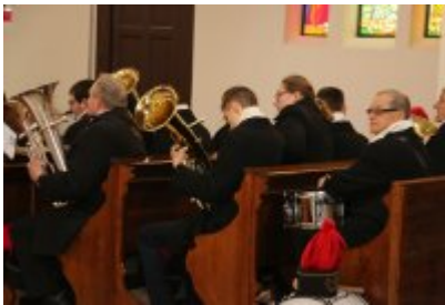
• Barbórka 2018