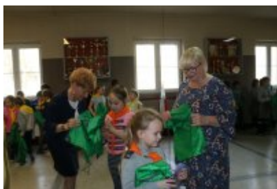
Zakończenie I turnusu HAZ