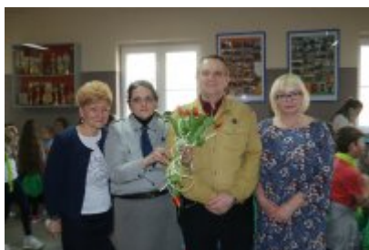
Zakończenie I turnusu HAZ