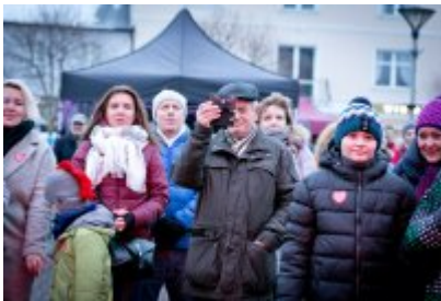
• 27. Finał Wielkiej Orkiestry Świątecznej Pomocy