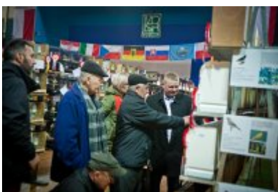
• 81. Ornitologiczne Mistrzostwa Polski