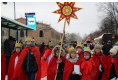
• Orszak Trzech Króli (2019)