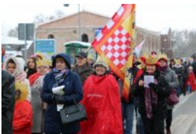
• Orszak Trzech Króli (2019)