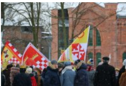
• Orszak Trzech Króli (2019)