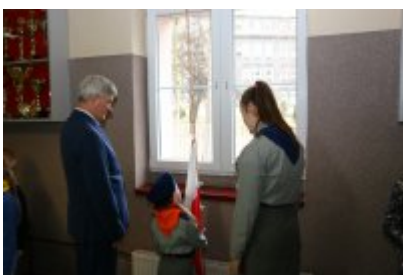
Harcerska Akcja Zima