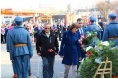
• Obchody 100-lecia odzyskania niepodległości cz. 2