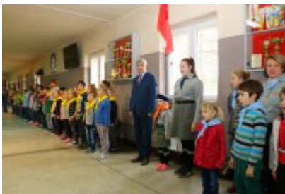
Harcerska Akcja Zima