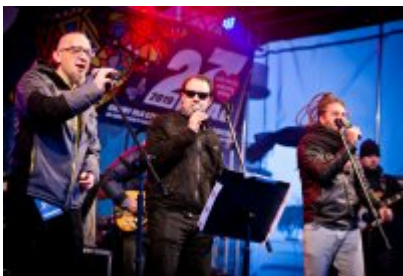
• 27. Finał Wielkiej Orkiestry Świątecznej Pomocy