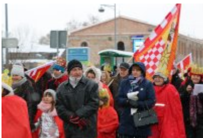
• Orszak Trzech Króli (2019)