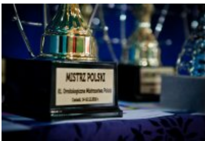
• 81. Ornitologiczne Mistrzostwa Polski