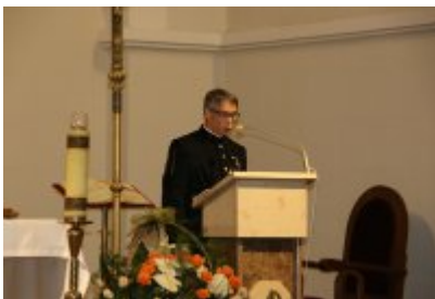
• Barbórka 2018