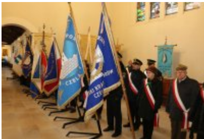
• Odświeżenie pomnika Jurka Bitschana