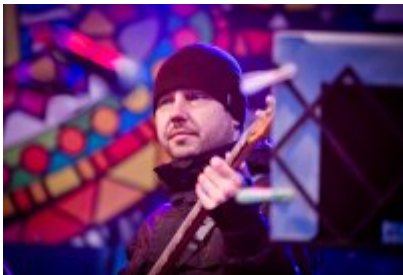
• 27. Finał Wielkiej Orkiestry Świątecznej Pomocy