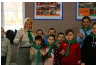
Harcerska Akcja Zima