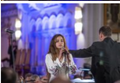
XXIII Festiwal Ave Maria Turniej Tenorów, cz. 1