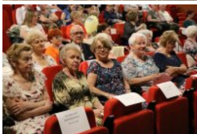
• Święto Jednoczenia Pokoleń