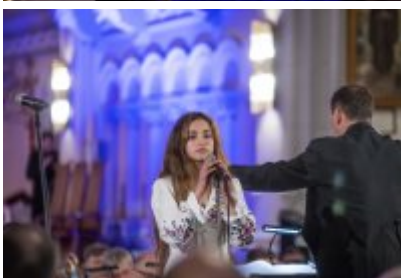
XXIII Festiwal Ave Maria Turniej Tenorów, cz. 1