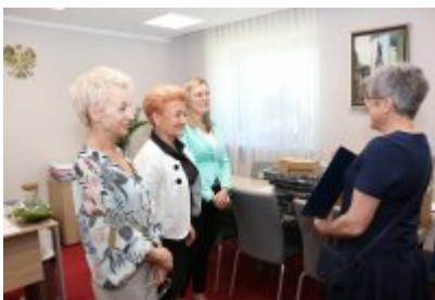
• Przekazanie laptopów dla urzędu