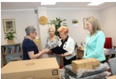
• Przekazanie laptopów dla urzędu