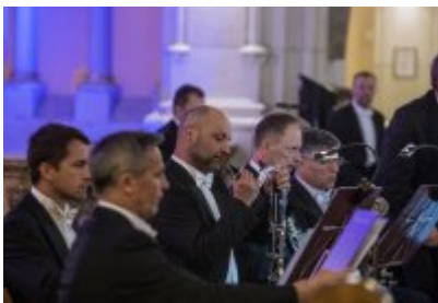
XXIII Festiwal Ave Maria Turniej Tenorów, cz. 1