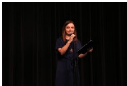
• Święto Jednoczenia Pokoleń