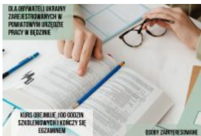
• Zaproszenie na kurs języka polskiego dla obywateli Ukrainy