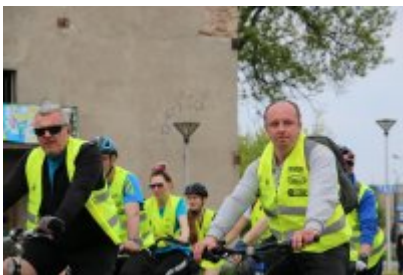
Zagłębiowska Masa Krytyczna 2022