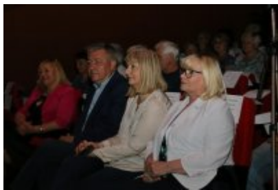
• Święto Jednoczenia Pokoleń