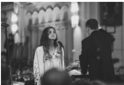
XXIII Festiwal Ave Maria Turniej Tenorów, cz. 1