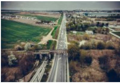
• Zagłębiowska Masa Krytyczna 2022 z lotu ptaka