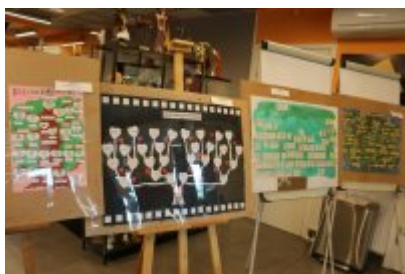
• Święto Jednoczenia Pokoleń