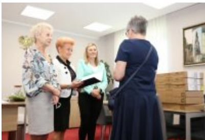
• Przekazanie laptopów dla urzędu