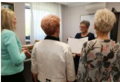
• Przekazanie laptopów dla urzędu