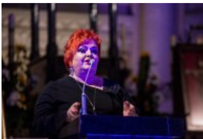
XXIII Festiwal Ave Maria Turniej Tenorów, cz. 1