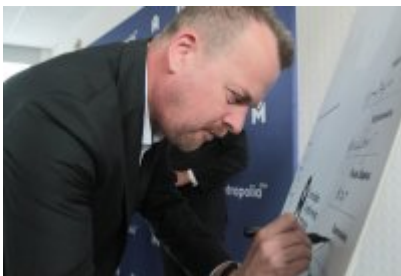
• Podpisanie porozumienia o budowie велоstrad w GZM