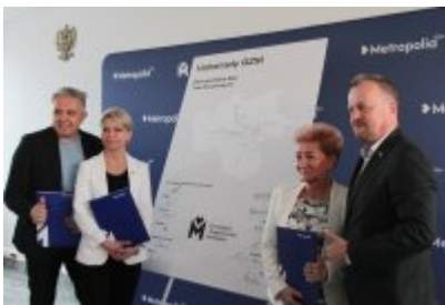
• Podpisanie porozumienia o budowie велоstrad w GZM