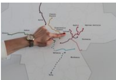
Podpisanie porozumienia o budowie велоstrad w GZM