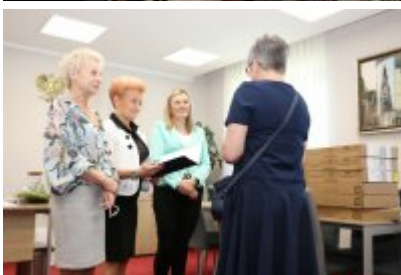
• Przekazanie laptopów dla urzędu