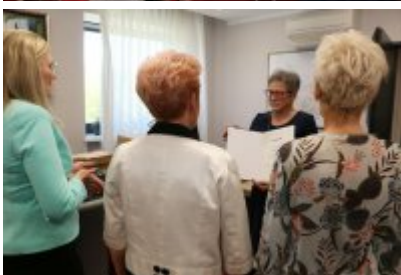
• Przekazanie laptopów dla urzędu