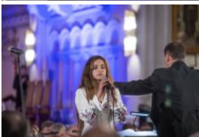
XXIII Festiwal Ave Maria Turniej Tenorów, cz. 1