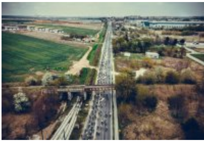
Zagłębiowska Masa Krytyczna 2022 z lotu ptaka