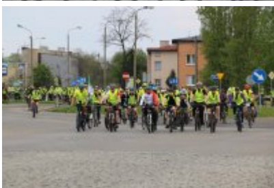
Zagłębiowska Masa Krytyczna 2022