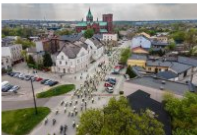
Zagłębiowska Masa Krytyczna 2022 z lotu ptaka