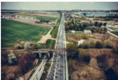
Zagłębiowska Masa Krytyczna 2022 z lotu ptaka