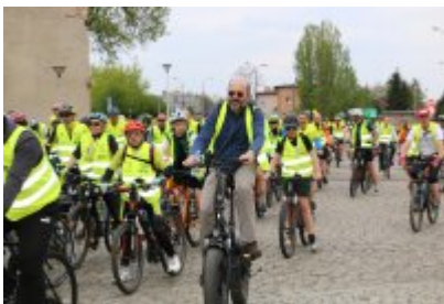
Zagłębiowska Masa Krytyczna 2022