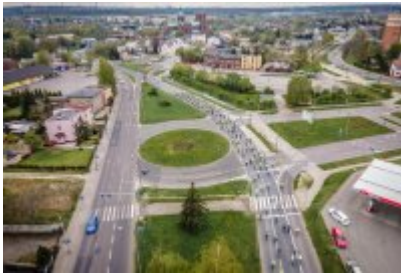
Zagłębiowska Masa Krytyczna 2022 z lotu ptaka