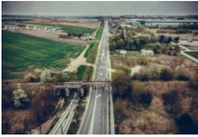
Zagłębiowska Masa Krytyczna 2022 z lotu ptaka