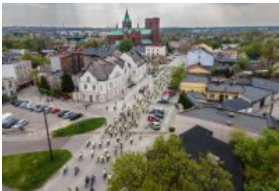
Zagłębiowska Masa Krytyczna 2022 z lotu ptaka