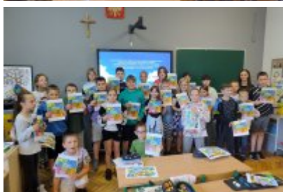
Ekologiczne spotkania w SP1