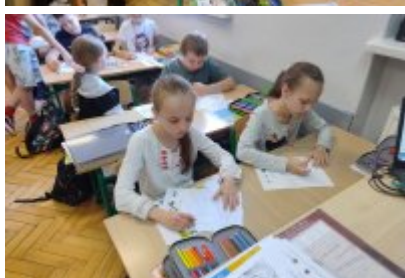
Ekologiczne spotkania w SP1