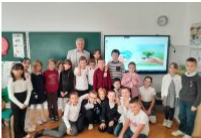
Zajęcia edukacyjne ekodoradcy w SP2