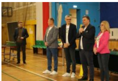
III Czeladzka Olimpiada Seniorów