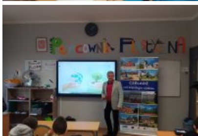
Kolejne zajęcia o smogu