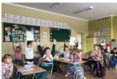
Zajęcia ekodoradcy w SP5