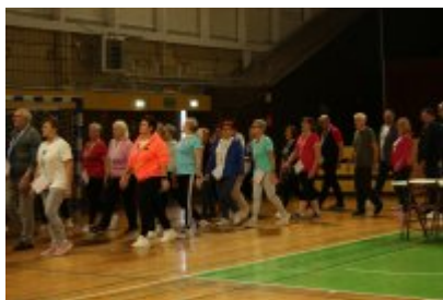
III Czeladzka Olimpiada Seniorów