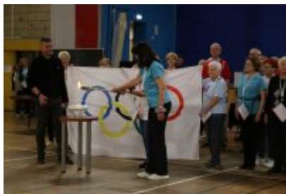
III Czeladzka Olimpiada Seniorów