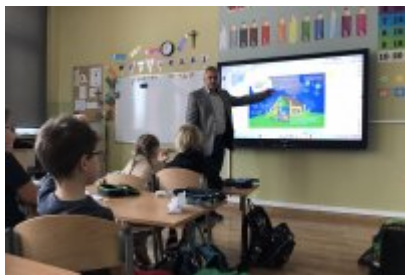
• Zajęcia ekodoradcy w SP5