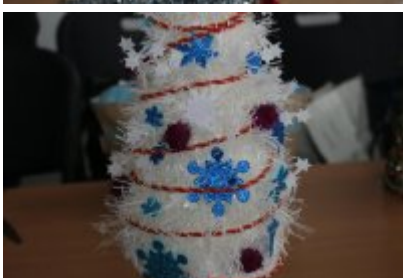
• Świąteczne warsztaty rękodzieła (28.11.2023)