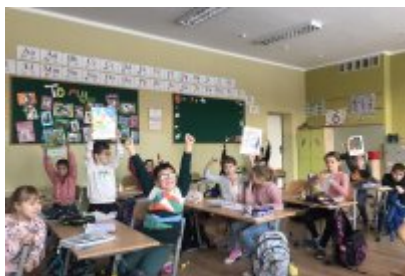
• Zajęcia ekodoradcy w SP5