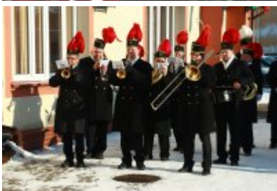
• Barbórka 2023 w Czeladzi