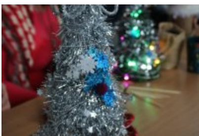
• Świąteczne warsztaty rękodzieła (28.11.2023)