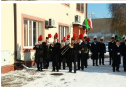
• Barbórka 2023 w Czeladzi