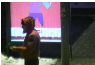
• Dewastacja Wiaty