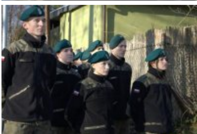
• Odświeżenie tablicy upamiętniającej Stanisława Boguckiego