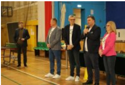
III Czeladzka Olimpiada Seniorów