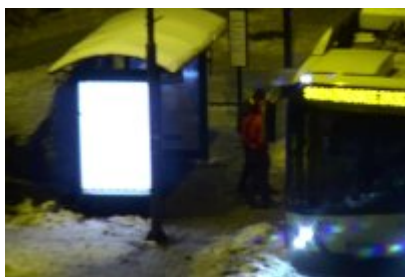
• Dewastacja Wiaty