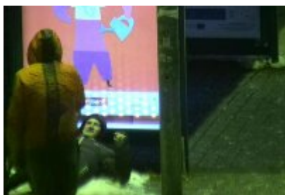
• Dewastacja Wiaty