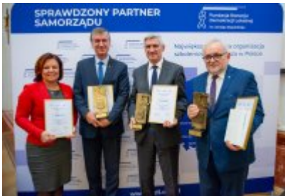
Ranking Gmin Województwa Śląskiego 2023