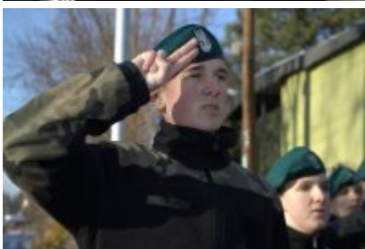
• Odświeżenie tablicy upamiętniającej Stanisława Boguckiego