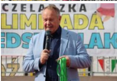
• I Czeladzka Olimpiada Przedszkolaka