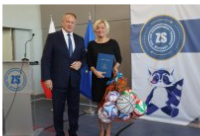
Pasowanie klas pierwszych w ZSOiT w Czeladzi