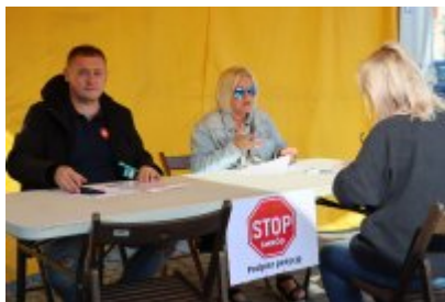
Piknik Ekologiczny w Czeladzi