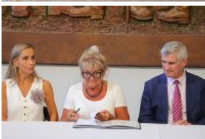
• Umowa z Adventure Multimedialne Muzea podpisana