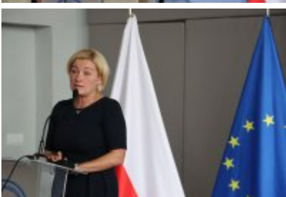
Otwarcie ekopracowni w ZSOiT w Czeladzi