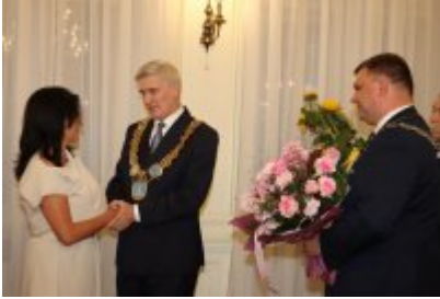
Uroczysta sesja Rady Miejskiej