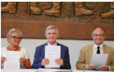
• Umowa z Adventure Multimedialne Muzea podpisana