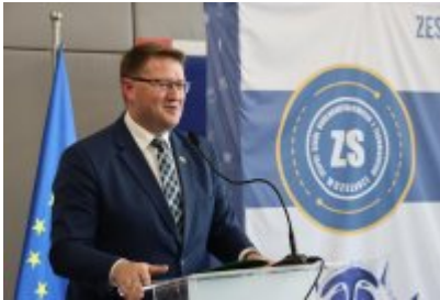
• Otwarcie ekopracowni w ZSOiT w Czeladzi