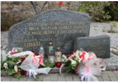
• 85. rocznica powstania Państwa Podziemnego