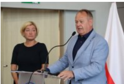
Otwarcie ekopracowni w ZSOiT w Czeladzi