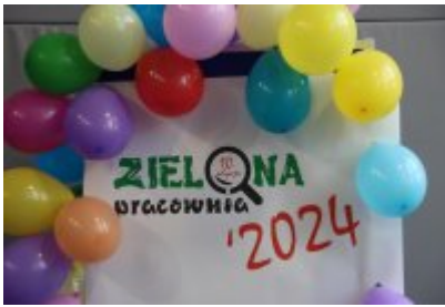
• Otwarcie ekopracowni w ZSOiT w Czeladzi