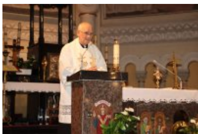
Diecezjalny Dzień Chorych