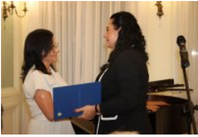
Uroczysta sesja Rady Miejskiej