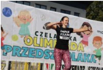
• I Czeladzka Olimpiada Przedszkolaka