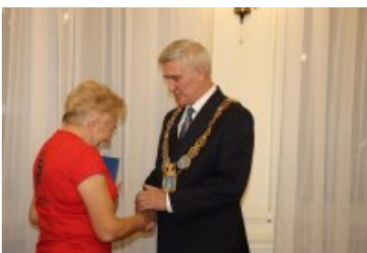
Uroczysta sesja Rady Miejskiej