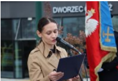
• 85. rocznica powstania Państwa Podziemnego