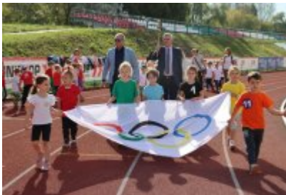
• I Czeladzka Olimpiada Przedszkolaka