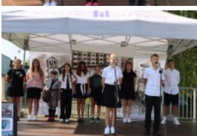
• Miejskie Rozpoczęcie Roku Szkolnego 2024/2025