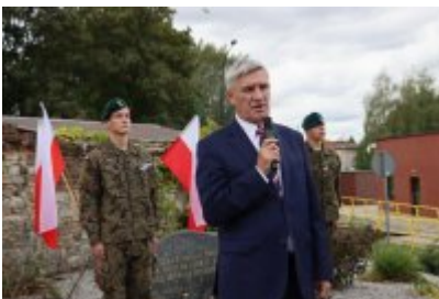
• 85. rocznica powstania Państwa Podziemnego