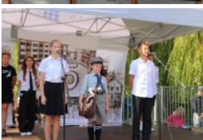
• Miejskie Rozpoczęcie Roku Szkolnego 2024/2025