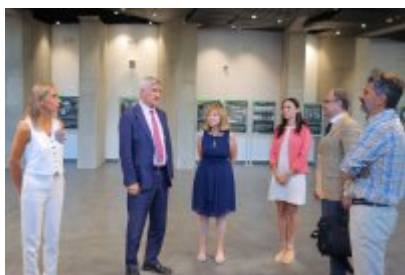
Umowa z Adventure Multimedialne Muzea podpisana