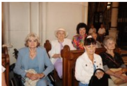
Diecezjalny Dzień Chorych