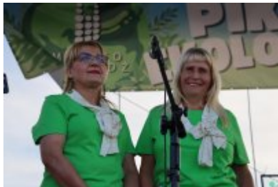
Piknik Ekologiczny w Czeladzi