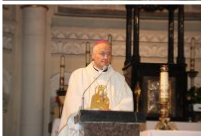
Diecezjalny Dzień Chorych