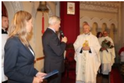
Diecezjalny Dzień Chorych