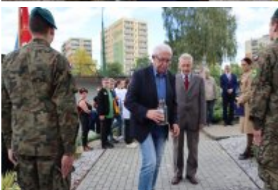
• 85. rocznica powstania Państwa Podziemnego