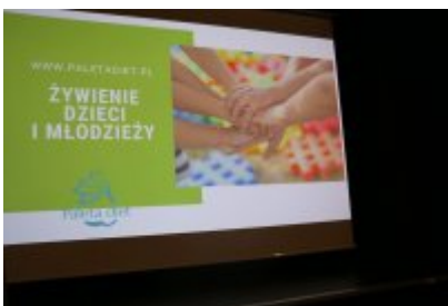
Jak zdrowo się odżywiać? Wykład dla szóstoklasistów