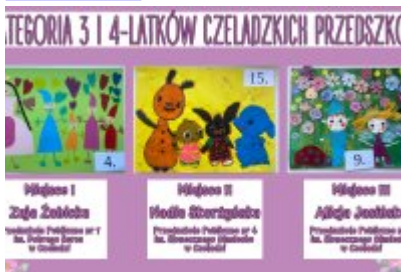
Nagrodzone prace w konkursie plastycznym „Moja Bajkowa Rodzina”