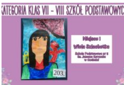
Nagrodzone prace w konkursie plastycznym „Moja Bajkowa Rodzina”