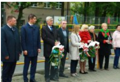
Rocznica likwidacji getta