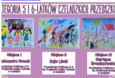
Nagrodzone prace w konkursie plastycznym „Moja Bajkowa Rodzina”