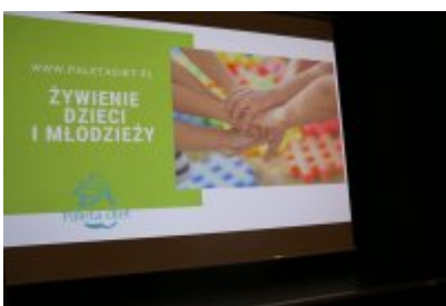
• Jak zdrowo się odżywiać? Wykład dla szóstoklasistów