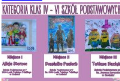
Nagrodzone prace w konkursie plastycznym „Moja Bajkowa Rodzina”