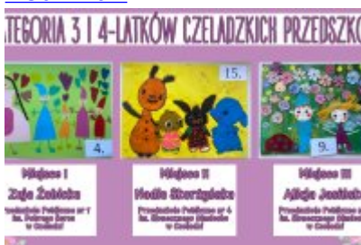
Nagrodzone prace w konkursie plastycznym „Moja Bajkowa Rodzina”