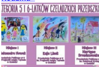
Nagrodzone prace w konkursie plastycznym „Moja Bajkowa Rodzina”