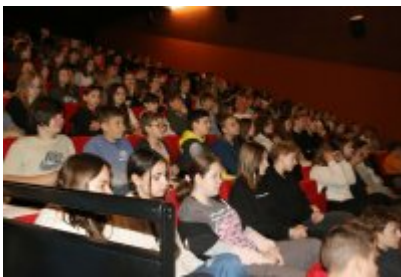
Jak zdrowo się odżywiać? Wykład dla szóstoklasistów