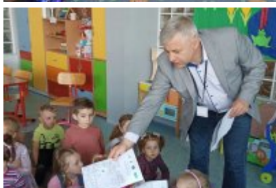
• Wizyta ekodoradcy w Przedszkolu Publicznym nr 10