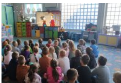
• Wizyta ekodoradcy w Przedszkolu Publicznym nr 10