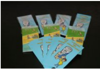
Jak zdrowo się odżywiać? Wykład dla szóstoklasistów