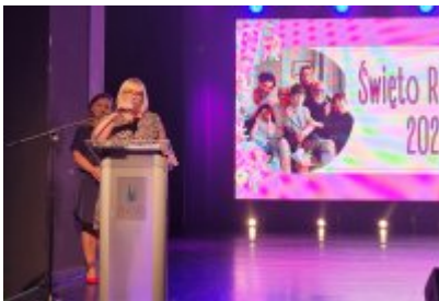
Święto Rodziny 2023