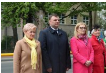
• 78. rocznica zakończenia drugiej wojny światowej