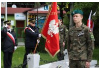
• 78. rocznica zakończenia drugiej wojny światowej