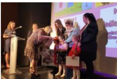
Święto Rodziny 2023