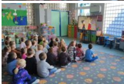
• Wizyta ekodoradcy w Przedszkolu Publicznym nr 10