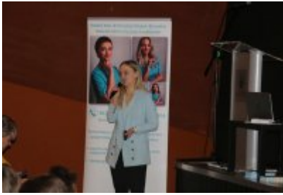
Jak zdrowo się odżywiać? Wykład dla szóstoklasistów