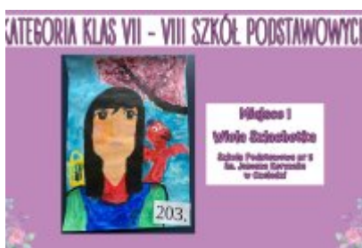
Nagrodzone prace w konkursie plastycznym „Moja Bajkowa Rodzina”