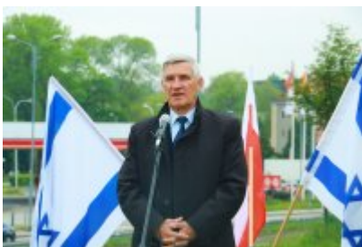
• Rocznicą likwidacji getta