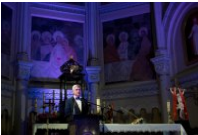
• XXIV Festiwal Ave Maria. Turniej Tenorów