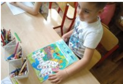
• Wizyta ekodoradcy w Przedszkolu Publiczne nr 11 w Czeladzi