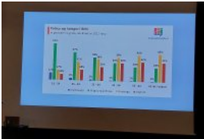
• Czeladzkie Spotkania Medyczne (11.05.2023)