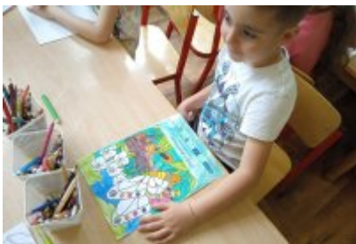
• Wizyta ekodoradcy w Przedszkolu Publiczne nr 11 w Czeladzi