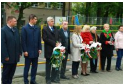
Rocznica likwidacji getta