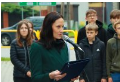
• Rocznicą likwidacji getta