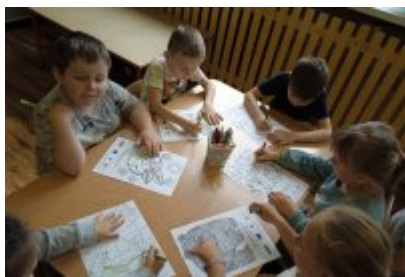
Wizyta ekodoradcy w Przedszkolu Publiczne nr 11 w Czeladzi