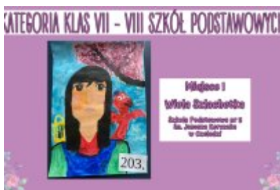
Nagrodzone prace w konkursie plastycznym „Moja Bajkowa Rodzina”