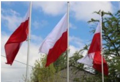
• 78. rocznica zakończenia drugiej wojny światowej