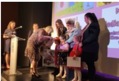
Święto Rodziny 2023