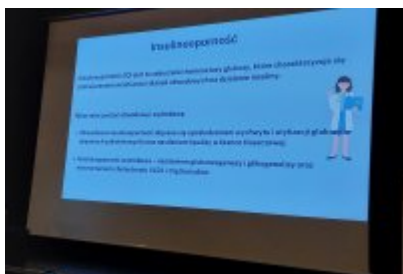
• Czeladzkie Spotkania Medyczne (11.05.2023)