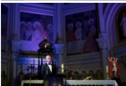
• XXIV Festiwal Ave Maria. Turniej Tenorów