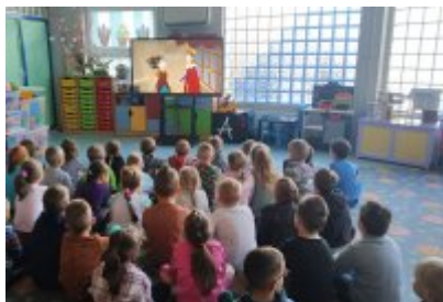
• Wizyta ekodoradcy w Przedszkolu Publicznym nr 10