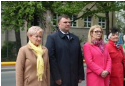
• 78. rocznica zakończenia drugiej wojny światowej