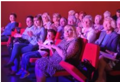
Święto Rodziny 2023