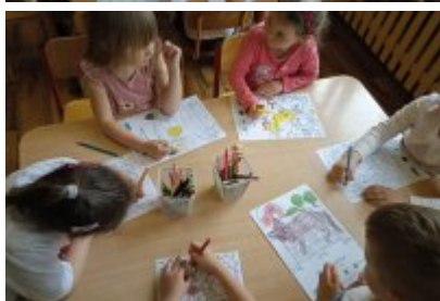
Wizyta ekodoradcy w Przedszkolu Publiczne nr 11 w Czeladzi