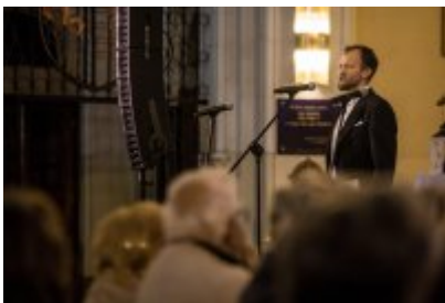
• XXIV Festiwal Ave Maria. Turniej Tenorów