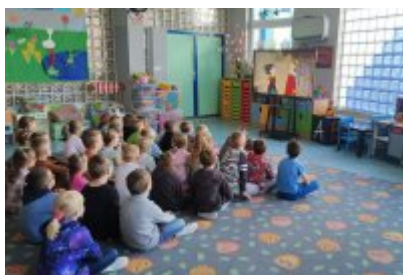
• Wizyta ekodoradcy w Przedszkolu Publicznym nr 10