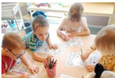
• Wizyta ekodoradcy w Przedszkolu Publicznym nr 10