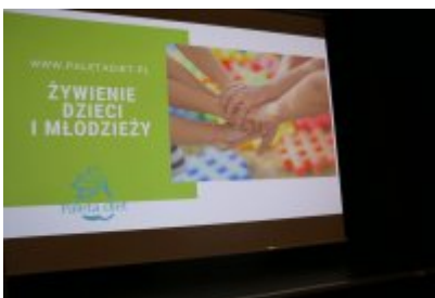
Jak zdrowo się odżywiać? Wykład dla szóstoklasistów