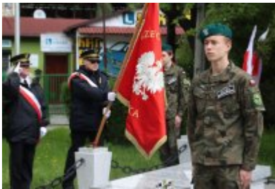
• 78. rocznica zakończenia drugiej wojny światowej