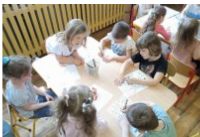
Wizyta ekodoradcy w Przedszkolu Publiczne nr 11 w Czeladzi