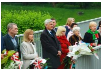
Rocznica likwidacji getta