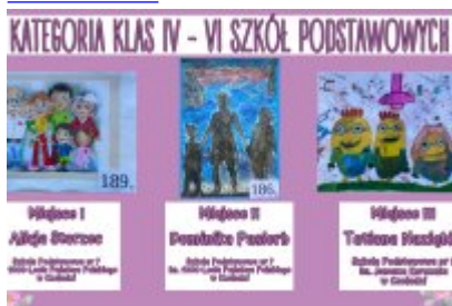
Nagrodzone prace w konkursie plastycznym „Moja Bajkowa Rodzina”