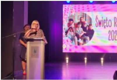
Święto Rodziny 2023