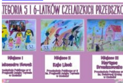
Nagrodzone prace w konkursie plastycznym „Moja Bajkowa Rodzina”