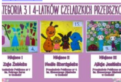
Nagrodzone prace w konkursie plastycznym „Moja Bajkowa Rodzina”