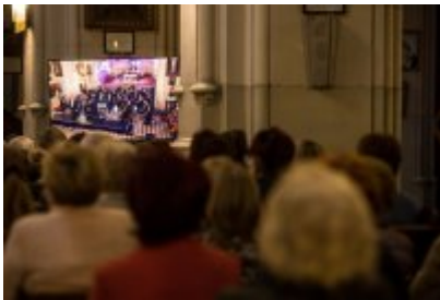
• XXIV Festiwal Ave Maria. Turniej Tenorów