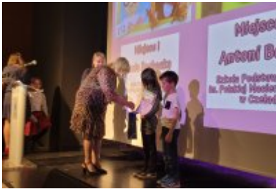
Święto Rodziny 2023