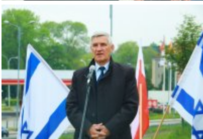
• Rocznicą likwidacji getta