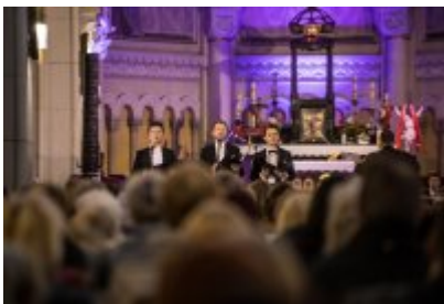
• XXIV Festiwal Ave Maria. Turniej Tenorów