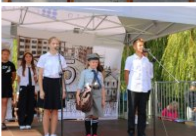
• Miejskie Rozpoczęcie Roku Szkolnego 2024/2025