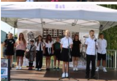
• Miejskie Rozpoczęcie Roku Szkolnego 2024/2025