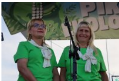
Piknik Ekologiczny w Czeladzi