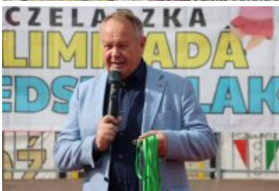
• I Czeladzka Olimpiada Przedszkolaka