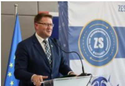
• Otwarcie ekopracowni w ZSOiT w Czeladzi