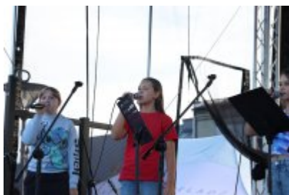
Piknik Ekologiczny w Czeladzi