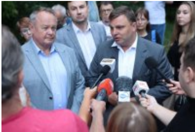
• Protest mieszkańców w sprawie uciążliwego zapachu