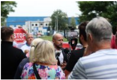
• Protest mieszkańców w sprawie uciążliwego zapachu