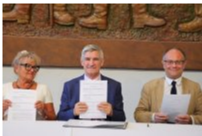
• Umowa z Adventure Multimedialne Muzea podpisana