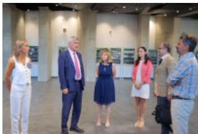
• Umowa z Adventure Multimedialne Muzea podpisana