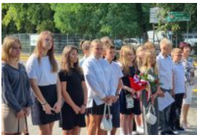
• 85. rocznica wybuchu II wojny światowej