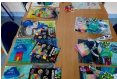
O smogu i ekologii z uczniami