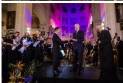
XXV Festiwal Ave - kościół św. Stanisława