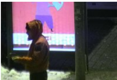
• Dewastacja Wiaty