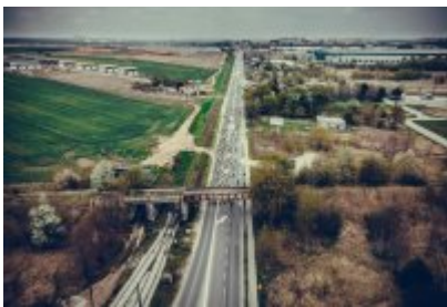
Zagłębiowska Masa Krytyczna 2022 z lotu ptaka