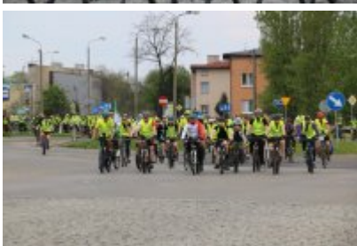
Zagłębiowska Masa Krytyczna 2022