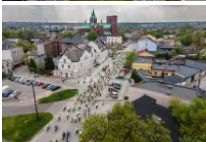
Zagłębiowska Masa Krytyczna 2022 z lotu ptaka