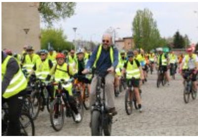
Zagłębiowska Masa Krytyczna 2022