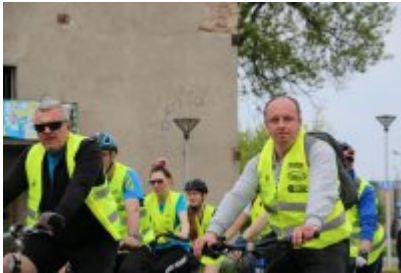
Zagłębiowska Masa Krytyczna 2022