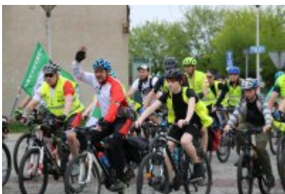
Zagłębiowska Masa Krytyczna 2022