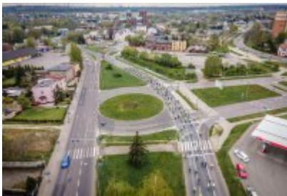
Zagłębiowska Masa Krytyczna 2022 z lotu ptaka