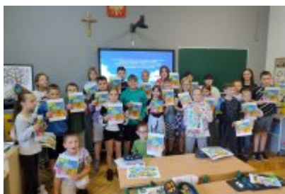
Ekologiczne spotkania w SP1