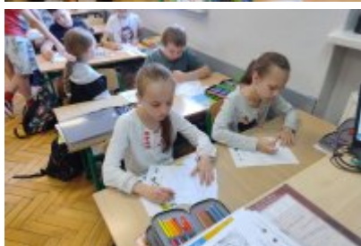
Ekologiczne spotkania w SP1