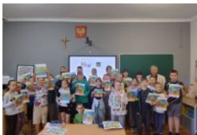
Ekologiczne spotkania w SP1