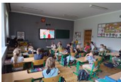
Ekologiczne spotkania w SP1