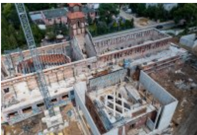
• Głosujemy na Cechownię