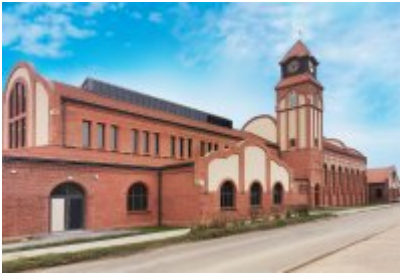
• Głosujemy na Cechownię