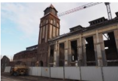
• Głosujemy na Cechownię