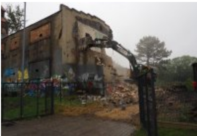
• Głosujemy na Cechownię