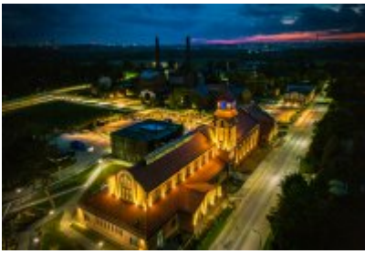
• Głosujemy na Cechownię