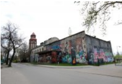
• Głosujemy na Cechownię