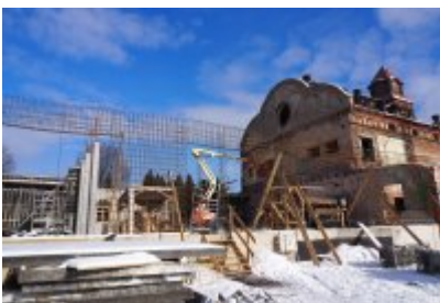
• Głosujemy na Cechownię