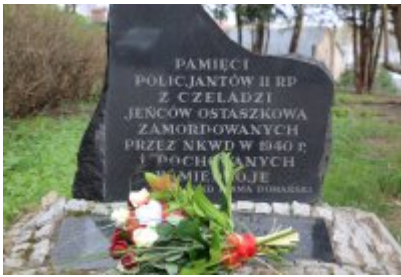
Czeladź pamięta o ofiarach Zbrodni Katyńskiej