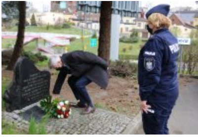
Czeladź pamięta o ofiarach Zbrodni Katyńskiej