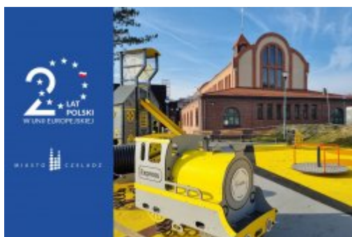
Majówka na Saturnie

1 maja świętujemy 20. rocznicę przystąpienia Polski do Unii Europejskiej! Z tej okazji zapraszamy na wyjątkowe wydarzenie, którym niewątpliwie będzie „Majówka na Saturnie”!