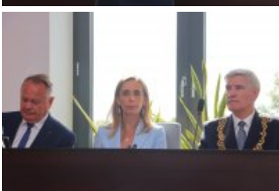
Pierwsza sesja Rady Miejskiej w Czeladzi w kadencji 2024-2029