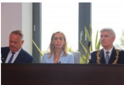
Pierwsza sesja Rady Miejskiej w Czeladzi w kadencji 2024-2029