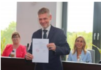
Pierwsza sesja Rady Miejskiej w Czeladzi w kadencji 2024-2029