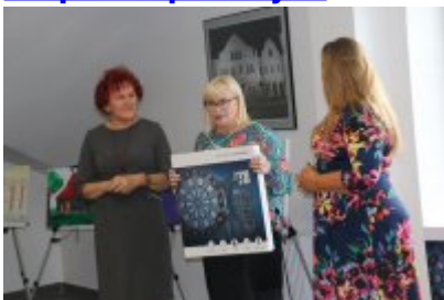
• Wernisaż X Czeladzkich Spotkań Plenerowych Osób