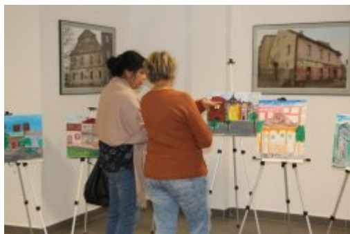
Czeladzkie Spotkania Plenerowe