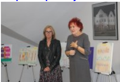
• Wernisaż X Czeladzkich Spotkań Plenerowych Osób