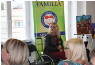
• Wernisaż X Czeladzkich Spotkań Plenerowych Osób