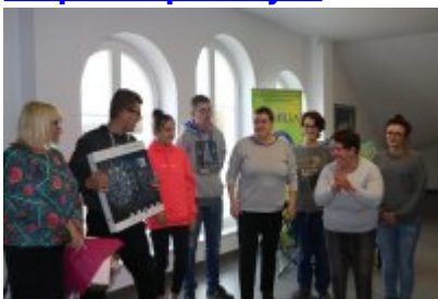
• Wernisaż X Czeladzkich Spotkań Plenerowych Osób