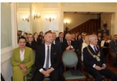
• Uroczysta sesja Rady Miejskiej