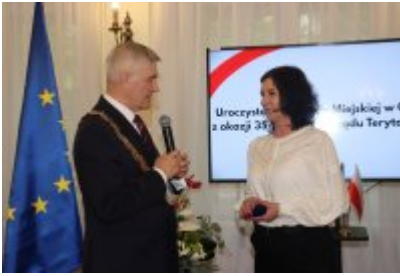
• Uroczysta sesja Rady Miejskiej