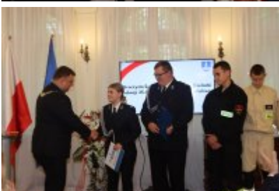
• Uroczysta sesja Rady Miejskiej