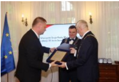
• Uroczysta sesja Rady Miejskiej