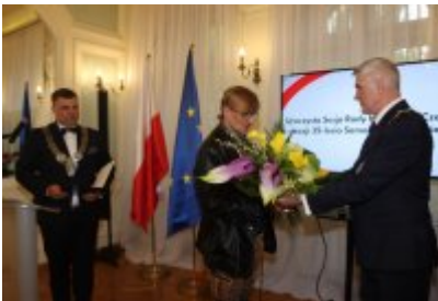
• Uroczysta sesja Rady Miejskiej