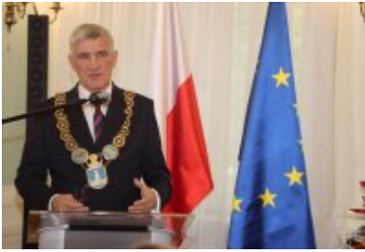
• Uroczysta sesja Rady Miejskiej