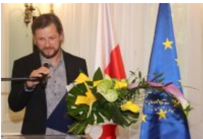
• Uroczysta sesja Rady Miejskiej