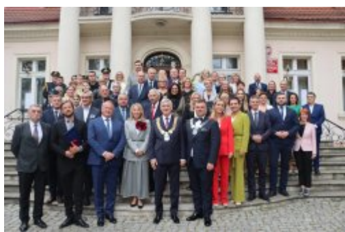
Uroczysta sesja Rady Miejskiej

Z okazji przypadającego w maju tego roku 35-lecia samorządu terytorialnego, 14 maja 2025 roku, w reprezentacyjnej Sali Lustrzanej Muzeum Saturn odbyła się uroczysta sesja Rady Miejskiej w Czeladzi. Była to również okazja do wręczenia dorocznych Nagród Miasta oraz innych wyróżnień. Po raz pierwszy przyznane zostały również medale Za Zasługi dla Miasta Czeladź.