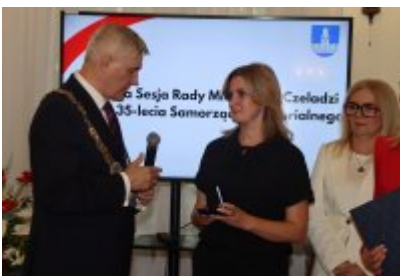
• Uroczysta sesja Rady Miejskiej