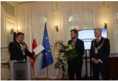
• Uroczysta sesja Rady Miejskiej