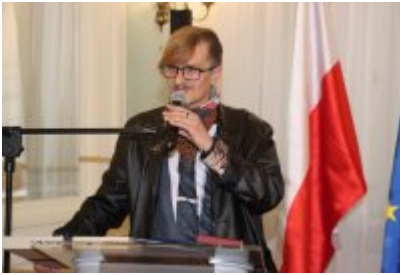
• Uroczysta sesja Rady Miejskiej