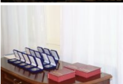
• Uroczysta sesja Rady Miejskiej