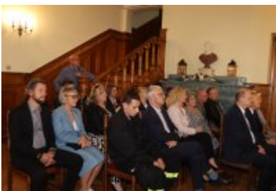
• Uroczysta sesja Rady Miejskiej