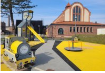
• Głosujemy na Cechownię