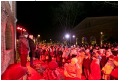
Otwarcie Centrum Usług Społecznościowych i Aktywności