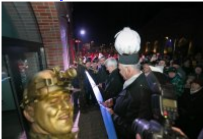
Otwarcie Centrum Usług Społecznościowych i Aktywności