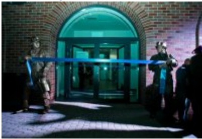
Otwarcie Centrum Usług Społecznościowych i Aktywności