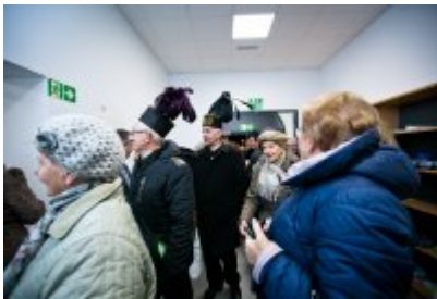
Otwarcie Centrum Usług Społecznościowych i Aktywności