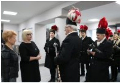
Barbórkowe msze święte