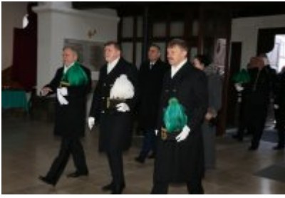
• Barbórkowe msze święte