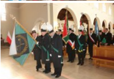
• Barbórkowe msze święte