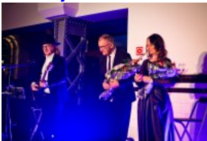
Otwarcie Centrum Usług Społecznościowych i Aktywności Lokalnej