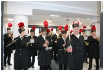
• Barbórkowe msze święte