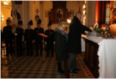
• Barbórkowe msze święte