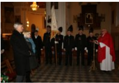
• Barbórkowe msze święte