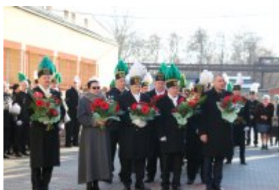
Barbórkowe msze święte