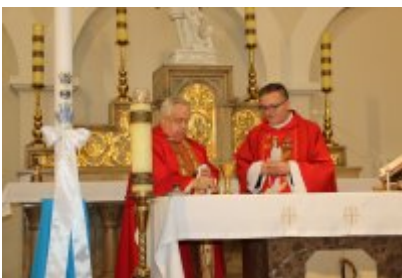
• Barbórkowe msze święte