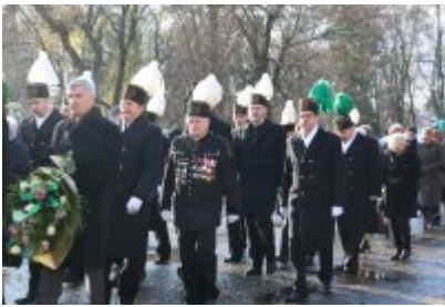
• Barbórkowe msze święte