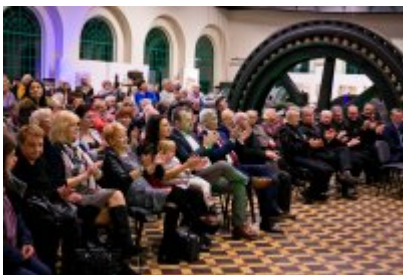
Otwarcie Centrum Usług Społecznościowych i Aktywności Lokalnej