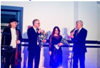
Otwarcie Centrum Usług Społecznościowych i Aktywności Lokalnej