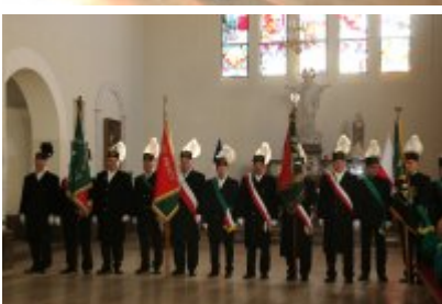
• Barbórkowe msze święte