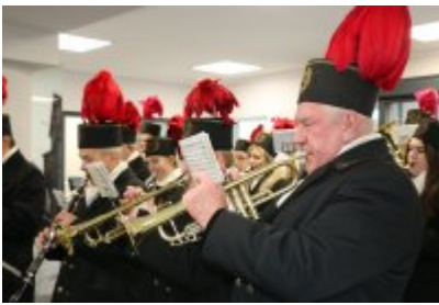
• Barbórkowe msze święte