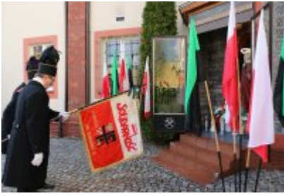
• Barbórkowe msze święte