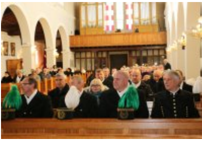
• Barbórkowe msze święte