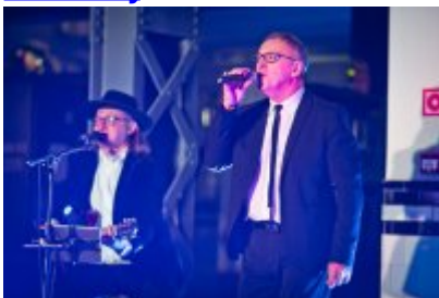
Otwarcie Centrum Usług Społecznościowych i Aktywności Lokalnej