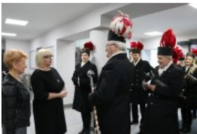
Barbórkowe msze święte