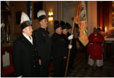
• Barbórkowe msze święte