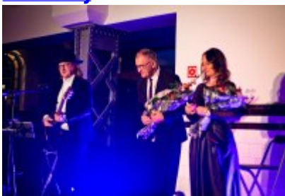
• Otwarcie Centrum Usług Społecznościowych i Aktywności Lokalnej