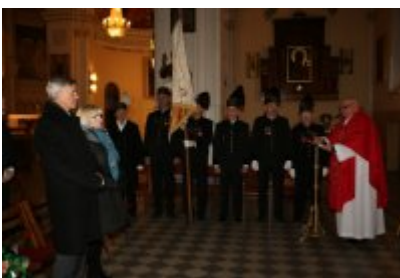
• Barbórkowe msze święte