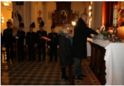
• Barbórkowe msze święte