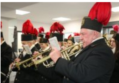
• Barbórkowe msze święte